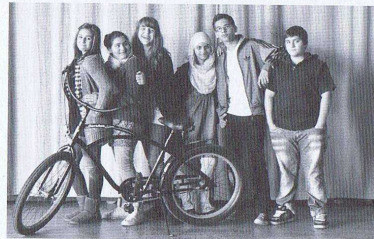
Schülerinnen und Schüler der Hauptschule an der Situlstraße setzen auf das Fahrrad - Mobil mit Stil!

sich mit ihrem Lebensstil auseinanderzusetzen, umweltbewusste Mobilität zu erleben und den Spaß an alternativer Fortbewegung zum Ausdruck zu bringen.