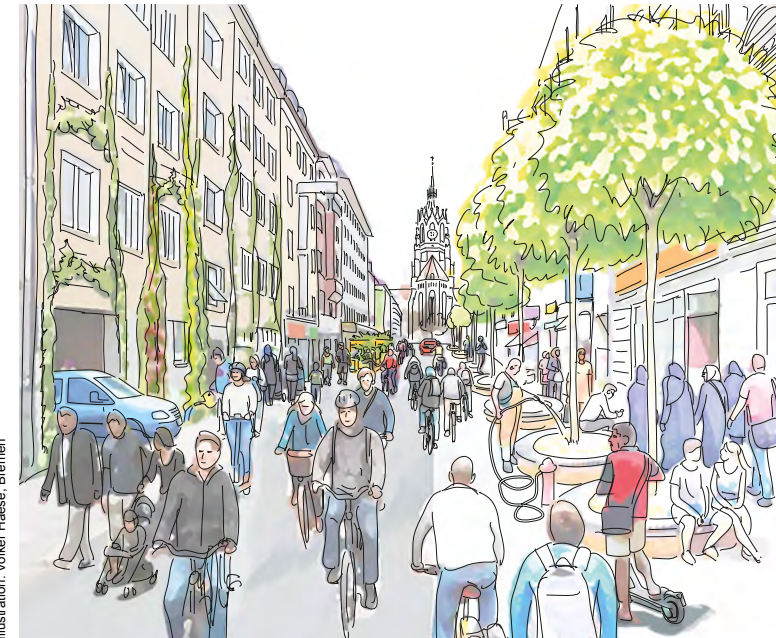
Illustration: Volker Haese, Bremen