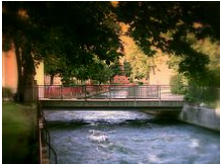
Auer Mühlbach in Untergiesing