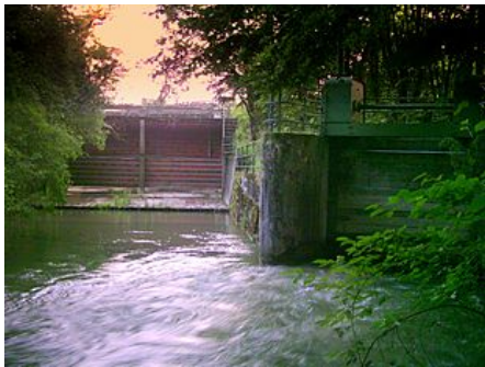
Austritt des Auer Mühlbachs aus dem Düker im Bild rechts, im Hintergrund die trockene Isarschleuse