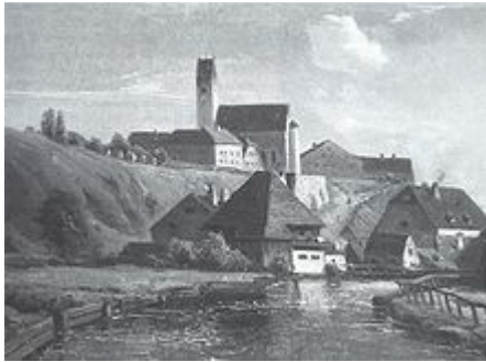
Auer Mühlbach in Giesing um 1850

Schon lange vor der „offiziellen“ Stadtgründung Münchens wurde die Wasserkraft der Isar für den Betrieb von Mühlen genutzt. Da die Isar bis zur zunehmenden Regulierung ab dem 19. Jahrhundert ein wilder Gebirgsfluss war, der seinen Lauf häufig änderte und starke Pegelschwankungen aufwies, baute man die Mühlräder nicht nur im Münchner Raum nicht am unberechenbaren Hauptarm, sondern an einem regulierbaren, künstlich abgeleiteten Nebenarm mit möglichst konstanter Wasserführung, dem Mühlbach . Die erste schriftliche Erwähnung des Baches und einer Mühle zu Kiesingenum (heute Untergiesing ) findet sich in einer Urkunde aus dem Jahre 957.