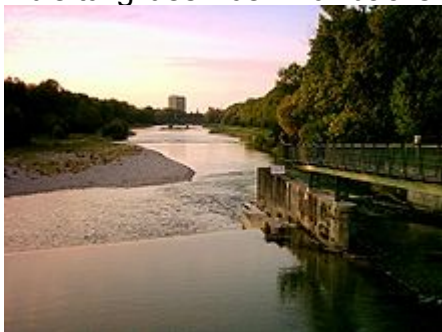
Die Kante des Wasserfalls zeigt den Verlauf des Dükers an

Um den steigenden Bedarf der Stadt an elektrischem Strom zu decken, wurde von 1905 bis 1907 westlich parallel zur Isar der Isar-Werkkanal angelegt, durch den das Potential der Isar für größere Wasserkraftwerke genutzt werden konnte. Seit Errichtung des Isarwerks 1 (Südwerk) im Jahr 1906 wird der Auer Mühlbach in der Nähe der Floßlande bei Flusskilometer 153,30 ( 48° 5' 31" N, 11° 32' 55" O ) an dem Wehr, das die Verlängerung des Marienklausenstegs bildet, aus diesem Kanal