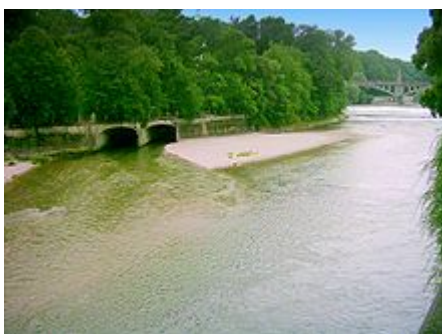
Mündung des Auer Mühlbachs (li.) in die Isar (re.)