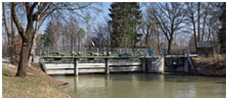
Ableitung des Auer Mühlbachs an der Wehranlage im Isar-Werkkanal