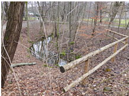
Freibadbächl in den Frühlingsanlagen